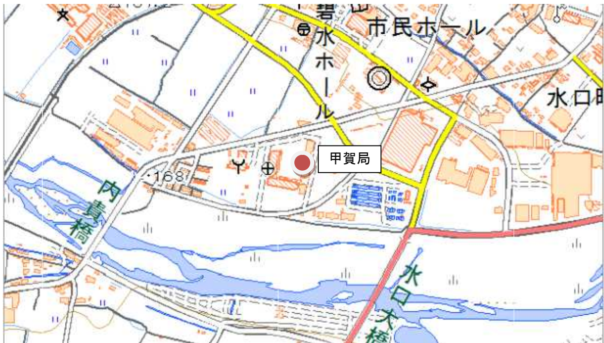
地図データ:国土地理院ウェブサイト「地理院地図」より