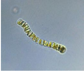
Cyclotella glomerata (ヒメマルケイソウ) 珪藻綱

細胞単体の形状は背の低い円筒形で、殻の直径は4～10 \mu mと小型です。通常は円形の面に対して鎖状に結合して群体を形成していますが、単体で確認されることもあります。