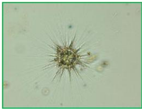
Raphidiophrys sp. (ラフィディオフリス) 太陽虫類

体は球形で放射状に有軸仮足を出しています。有軸仮足の根元は粘液と多数の骨片におおわれているのが特徴です。琵琶湖では春と秋に多く確認されます。