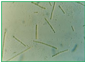
Phormidium tenue (フォルミディウム テヌエ) 藍藻綱

楕円形または倒卵形の細胞が寒天質の表層に規則正しく配列し、球状の群体を形成する。各細胞は不等長の2本の鞭毛を有する。生ぐさ臭を発生し、水道水の異臭味の原因となる藻類である。