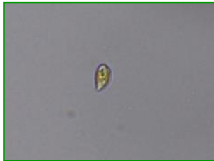
Rhodomonas sp. (ロドモナス) 褐色鞭毛藻綱

細胞の形は長楕円もしくは長卵形で、長さが約10 \mu mと小型です。単細胞性で前端よりの細胞口から2本の鞭毛が伸びており、これらを使って回転しながら遊泳しています。葉緑体は1個で、少し黄色みを帯びています。