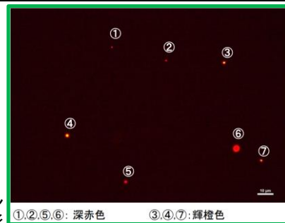
ピコ植物プランクトン 1,000倍G励起で撮影 (倍率: 10×20倍)