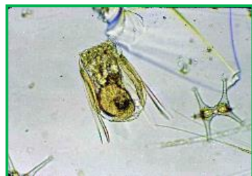
Polyarthra vulgaris (ハネウデワムシ) ワムシ類

体は四角く、4カ所に3本ずつ鳥の羽状の付属物を有しています。前部に2本の触角があります。琵琶湖、瀬田川で見られるワムシの中で、よく見られる種類の一つです。