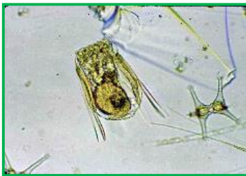
Polyarthra vulgaris (ハネウデワムシ) ワムシ類

体は四角く、4カ所に3本ずつ鳥の羽状の付属物を有しています。前部に2本の触角があります。琵琶湖、瀬田川で見られるワムシの中で、よく見られる種類の一つです。