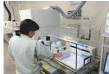
ICP/MSによる金属類の分析