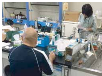
COD分析およびSS分析の様子 (手前:COD、奥:SS)