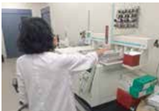
GC/MSによる揮発性有機化合物の分析