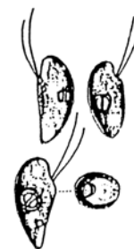
Rhodomonas sp. (ロドモナス) 褐色鞭毛藻綱

細胞は、長楕円形で長さが約10 \mu\text{m} と小型であり、葉緑体は少し赤みを帯びている。 2本の鞭毛を有する。