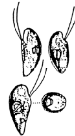
Rhodomonas sp. (ロドモナス) 褐色鞭毛藻綱

細胞は、長楕円形で長さが約10 \mu\text{m} と小型であり、葉緑体は少し赤みを帯びている。 2本の鞭毛を有する。