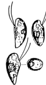
Rhodomonas sp. (ロドモナス) 褐色鞭毛藻綱

細胞は、長楕円形で長さが約 10\mu\text{m} と小型であり、葉緑体は少し赤みを帯びている。 2本の鞭毛を有する。