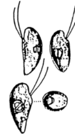
Rhodomonas sp. (ロドモナス) 褐色鞭毛藻綱

細胞は、長楕円形で長さが約10 \mu\text{m} と小型であり、葉緑体は少し赤みを帯びている。 2本の鞭毛を有する。