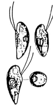
Rhodomonas sp. (ロドモナス) 褐色鞭毛藻綱

細胞は、長楕円形で長さが約 10\mu\text{m} と小型であり、葉緑体は少し赤みを帯びている。 2本の鞭毛を有する。