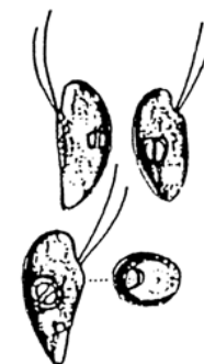
Rhodomonas sp. (ロドモナス) 褐色鞭毛藻綱

細胞は、長楕円形で長さが約 10\mu\text{m} と小型であり、葉緑体は少し赤みを帯びている。2本の鞭毛を有する。