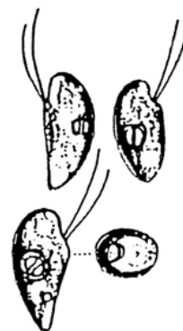
Rhodomonas sp. (ロドモナス) 褐色鞭毛藻綱

細胞は、長楕円形で長さが約 10\mu\text{m} と小型であり、葉緑体は少し赤みを帯びている。 2本の鞭毛を有する。