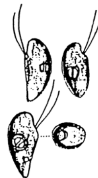
Rhodomonas sp. (ロドモナス) 褐色鞭毛藻綱

細胞は、長楕円形で長さが約 10\mu\text{m} と小型であり、葉緑体は少し赤みを帯びている。 2本の鞭毛を有する。