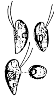
Rhodomonas sp. (ロードモナス) 褐色鞭毛藻綱

細胞は、長楕円形で長さが約 10\mu\text{m} と小型であり、葉緑体は少し赤みを帯びている。 2本の鞭毛を有する。