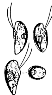
Rhodomonas sp. (ロードモナス) 褐色鞭毛藻綱

細胞は、長楕円形で長さが約10 \mu\text{m} と小型であり、葉緑体は少し赤みを帯びている。 2本の鞭毛を有する。