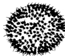
Uroglena americana (ウログレナ) 黄色鞭毛藻類

楕円形の細胞が球状の寒天質の表層に規則正しく配列し、球状の群体を形成する。各細胞は不等長の2本の鞭毛を有する。