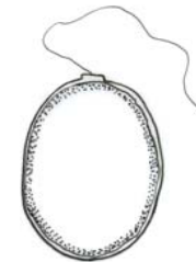
Trachelomonas oblonga (トラケロモナス) 緑藻綱