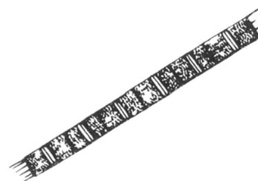
Melosira granulata (メロシラグラヌラータ) 珪藻綱

細胞は円筒形で、糸状の群体を形成する。 群体の両端に顕著な長い剛毛を1~3本有する。