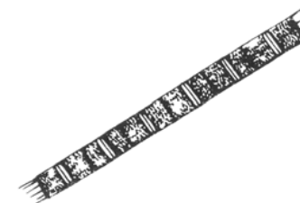
Melosira granulata (メロシラグラヌラータ) 珪藻綱

細胞は円筒形で、糸状の群体を形成する。群体の両端に顕著な長い剛毛を1~3本有する。