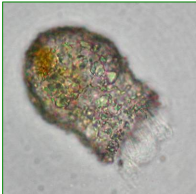
Codonella cratera (スナカラムシ) 繊毛虫類

壺のような固い殻を持ち、その殻は砂粒を含む。色は黒色で、前が開いていて、その後ろにくびれがある。