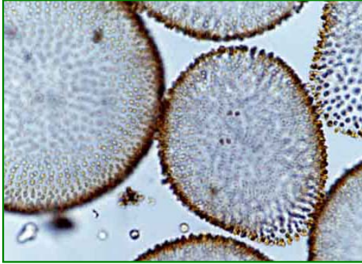
Uroglena americana (ウログレナ) 黄色鞭毛藻類

楕円形または倒卵形の細胞が寒天質の表層に規則正しく配列し、球状の群体を形成する。各細胞は不等長の2本の鞭毛を有する。生ぐさ臭を発生し、水道水の異臭味の原因となる藻類である。