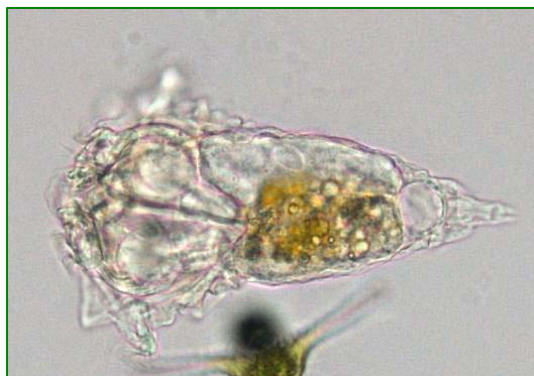
Synchaeta oblonga (ナガマルドロワムシ) 輪虫類

体は円錐形で足は短く、先端の爪は微小である。体長は220～260 \mu m。体側に縦の条線があるのが特徴である。