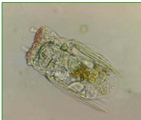
Polyarthra vulgaris (ハネウデワムシ) 輪虫類

体は四角く、4カ所に3本ずつ鳥の羽状の付属物を有する。 前部に2本の触角がある。