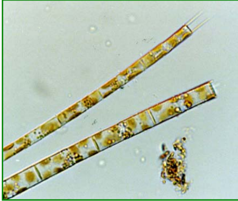
Aulacoseira granulata (アウラコセイラ)