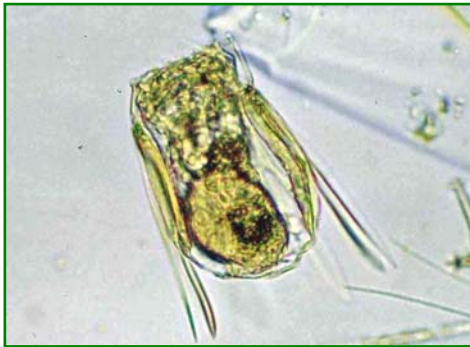
Polyarthra vulgaris (ハネウデワムシ)