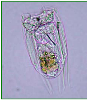
Polyarthra vulgaris (ハネウデワムシ) 輪虫類