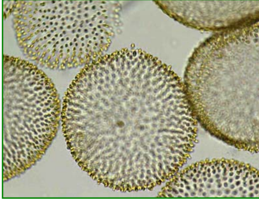
Uroglena americana (ウログレナ) 黄色鞭毛藻類

楕円形もしくは倒卵形の細胞が球状の寒天質の表層に規則正しく配列し、球状の群体を形成する。各細胞は不等長の2本の鞭毛を有する。