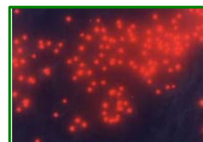
ピコ植物プランクトン 1,000倍G励起で撮影