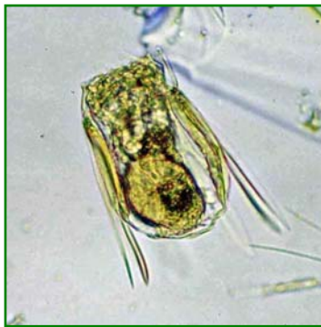
Polyarthra vulgaris (ハネウデワムシ) 輪虫類