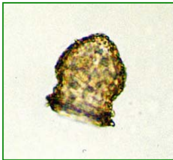
Codonella cratera (スナカラムシ) 繊毛虫類

壺のような固い殻を持ち、その殻は砂粒を含む。色は黒色で、前が開いていて、その後ろにくびれがある。