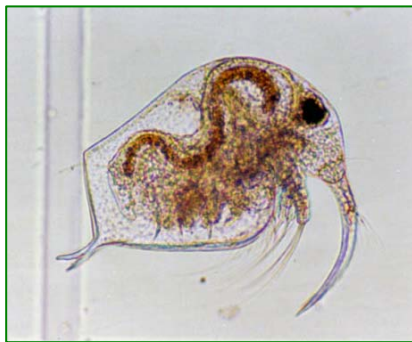
Bosmina longirostris (ゾウミジンコ) 甲殻類