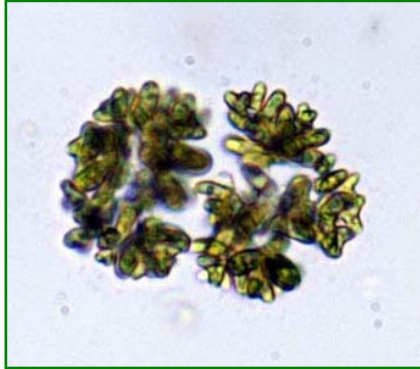
Dimorphococcus lunatus (ディモルフオコックス) 緑藻綱