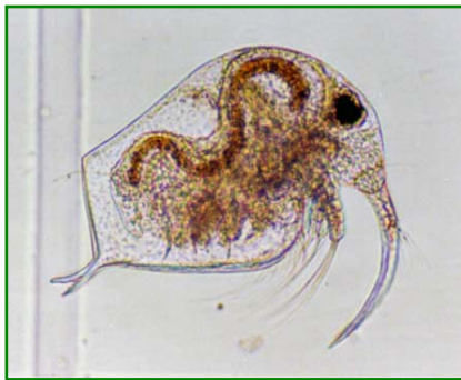
Bosmina longirostris (ゾウミジンコ) 甲殻類