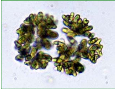
Dimorphococcus lunatus (ディモルフオコックス) 緑藻綱