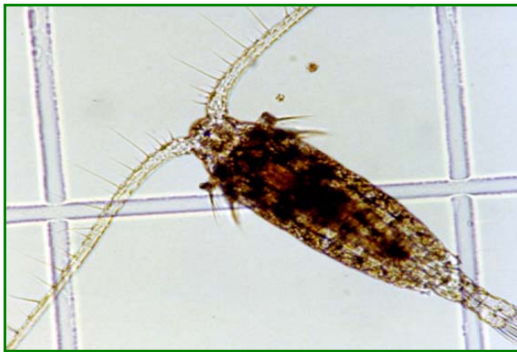
Eodiaptomus japonicus (ヤマトヒゲナガケンミジンコ) 甲殻類

北湖で夏の間、上層に多く見られる。 体長は雌1～1.4mm、雄1～1.2mm。 第1触角は長く叉肢刺毛をこえる。