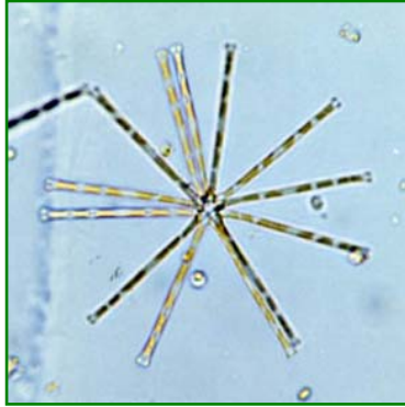
Asterionella formosa (ホシガタケイソウ) 珪藻綱

4～32個の細胞が端で接着し、ホシガタの群体を作る。細胞の殻面を見ると(通常は殻環面が見えている)両端が丸くなった長い棒形をしている。琵琶湖では以前から多く見られる種類である。