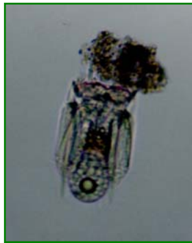
Polyarthra vulgaris (ハネウデワムシ) 輪虫類