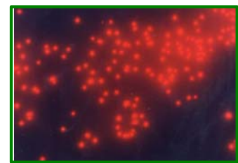
ピコ植物プランクトン 1,000倍G励起で撮影