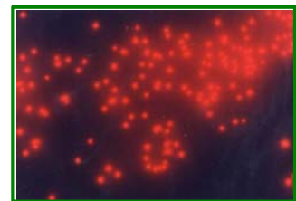
ピコ植物プランクトン 1,000倍G励起で撮影