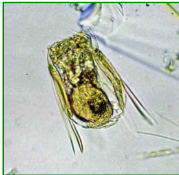
Polyarthra vulgaris (ハネウデワムシ) 輪虫類