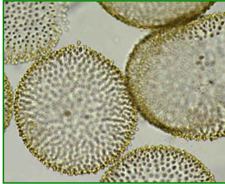
Uroglena americana (ウログレナ) 黄色鞭毛藻類

楕円形の細胞が球状の寒天質の表層に規則正しく配列し、球状の群体を形成する。各細胞は不等長の2本の鞭毛を有する。