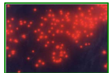
ピコ植物プランクトン 1,000倍G励起で撮影