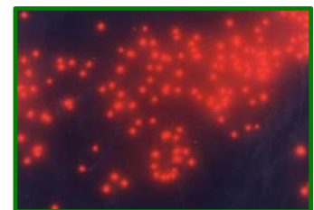
ピコ植物プランクトン 1,000倍G励起で撮影