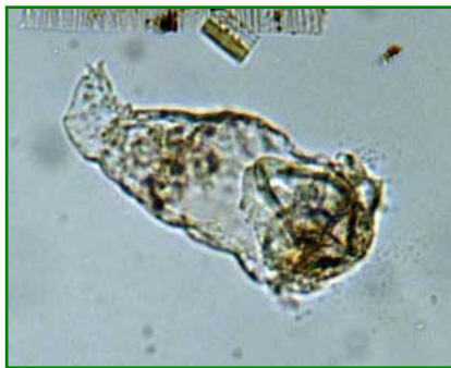
Synchaeta oblonga (ナガマルドロワムシ) 輪虫類

体は円錐形で足は短く、先端の爪は微小である。体長は225～345 μm。体側は縦の条線があるのが特徴である。