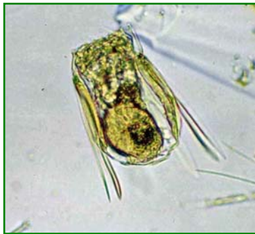
Polyarthra vulgaris (ハネウデワムシ) 輪虫類