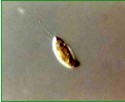
Cryptomonas sp. (クリプトモナス) 褐色鞭毛藻綱

体は長楕円であり、頂端は少しへこんで消化道を形成している。等長の2本の鞭毛を持つ。通常2個の大きな葉緑体を持ち、その色は黄色、褐色、赤色、赤褐色などさまざまである。