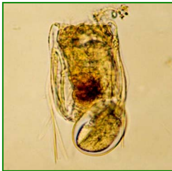
Polyarthra vulgaris (ハネウデワムシ) 輪虫類