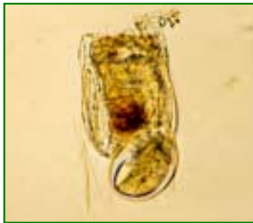
Polyarthra vulgaris (ハネウデワムシ) 輪虫類