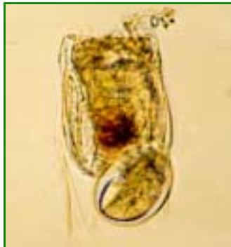
Polyarthra vulgaris (ハネウデワムシ) 輪虫類