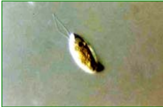
Cryptomonas sp. (クリプトモナス) 褐色鞭毛藻綱

体は長楕円であり、頂端は少しへこんで消化道を形成している。等長の2本の鞭毛を持つ。通常2個の大きな葉緑体を持ち、その色は黄色、褐色、赤色、赤褐色などさまざまである。