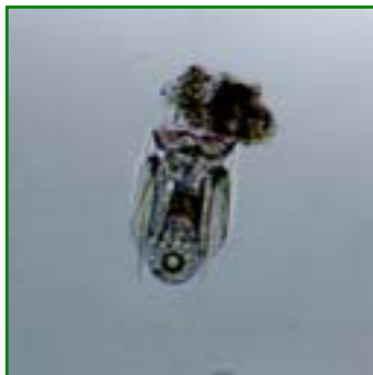
Polyarthra vulgaris (ハネウデワムシ) 輪虫類