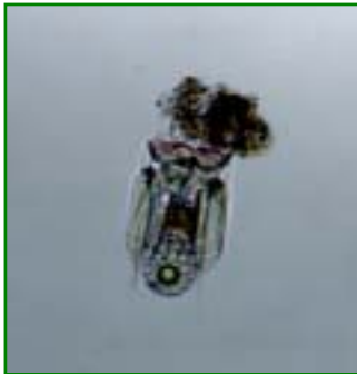
Polyarthra vulgaris (ハネウデワムシ) 輪虫類