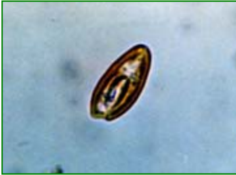
Cryptomonas sp. (クリプトモナス) 褐色鞭毛藻綱

体は長楕円であり、頂端は少しへこんで消化道を形成している。等長の2本の鞭毛を持つ。通常2個の大きな葉緑体を持ち、その色は黄色、褐色、赤色、赤褐色などさまざまである。