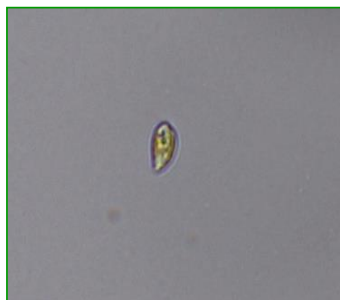
Rhodomonas sp. (ロドモナス) 褐色鞭毛藻綱

細胞は、長楕円形で長さが約10μmと小型であり、葉緑体は少し赤みを帯びている。2本の鞭毛を有する。