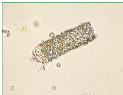
Tintinnidium fluviatile (フデツツカラムシ) 繊毛虫類