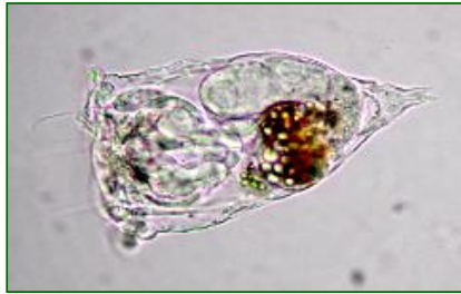
Synchaeta oblonga (ナガマルドロワムシ) 輪虫類

体は透明な鐘形で、足は短く、先端の趾(あしゆび)は微小である。頭冠は幅広く、前面には4本の長い剛毛があり、両端には長い繊毛をもつ耳状の突起がある。