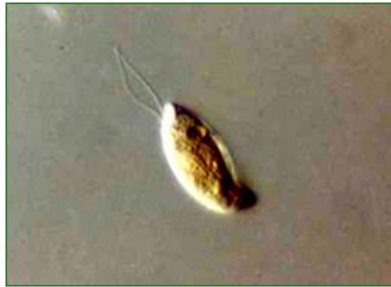
Cryptomonas sp. (クリプトモナス) 褐色鞭毛藻綱

体はやや扁平な長楕円形で、頂端は凹んで発達した陥入部を形成している。陥入部から伸びたほぼ等しい長さの2本の鞭毛を使って、進行方向を軸にして回転しながら泳ぐ。大きな葉緑体を持ち、その色は黄色、褐色、オリーブ色などさまざまである。