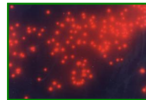
ピコ植物プランクトン 1,000倍G励起で撮影