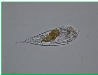
Trichocerca similis (フタヅノネズミワムシ) 輪虫類

ネズミワムシの一種で、殻の頭部に2本の等長のとげがある。体は円筒形で、後ろが細くなっている。体の後ろに2本の主爪があり、左爪が右爪より長い。