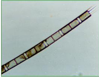
Aulacoseira granulata (アウラコセイラ) 珪藻綱

細胞は円筒形で、糸状の群体を形成する。殻の側壁に斜めに走る点紋列がある。群体の両端に顕著な長い棘状突起を有する。