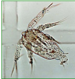
Nauplius (ノープリウス) 甲殻類