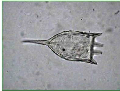
Keratella cochlearis (カメノコウワムシ) 輪虫類

背側と腹側の2枚の殻(被甲)を持つ。背甲は中央が著しく膨らみ、腹甲は扁平か少しへこむ。背甲表面に亀甲模様があり、背甲後端に1本の突起がある。匙(さじ)のような形状の小型のワムシである。後端にある突起の長さなどによって変種に分けられる。