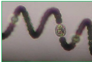
Anabaena spiroides var. crassa